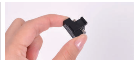
④ 새 퓨즈로 교체한 후 ②번 사진처럼 다시 조립해주세요.