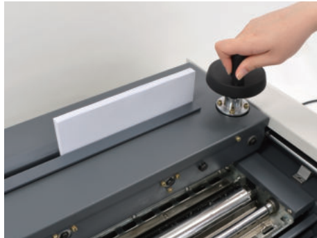
③ 원고를 원고대 끝에 밀착시켜 넣어주고 원고압착레버를 돌려 압착시켜줍니다.