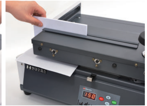
⑧ 제본이 완성되면 왼쪽 홈을 통해 작업물을 빼냅니다.