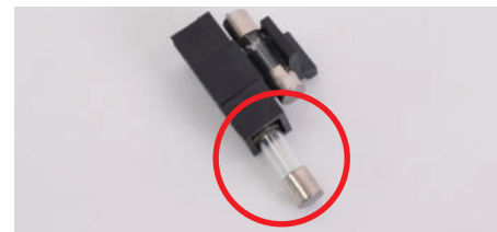
③ 퓨즈박스에 여분의 퓨즈가 들어있습니다.