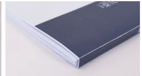
⑨ 제본 완성!