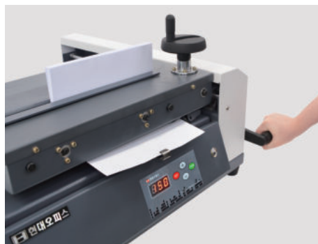
⑥ 오른쪽 표지 압착핸들을 내려 표지와 본드가 칠해진 부분에 표지가 씌워지도록 압착시켜줍니다. (압착을 늦게 하면 본드가 식어 접착력이 떨어집니다.)