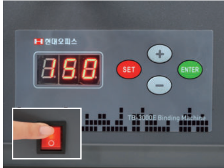
① 뒷면의 전원을 켜면 예열이 시작됩니다.