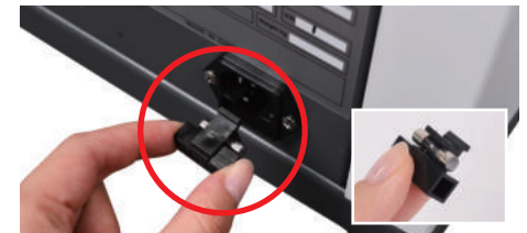
② 사진과 같이 퓨즈부분을 분리해 줍니다.