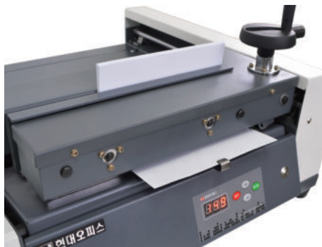
⑤ 시작버튼을 한 번 더 누르면 원고대가 앞뒤로 이동 하여 원고에 본드를 칠합니다. (본드칠이 완료되면 기기가 자동으로 멈춥니다.)