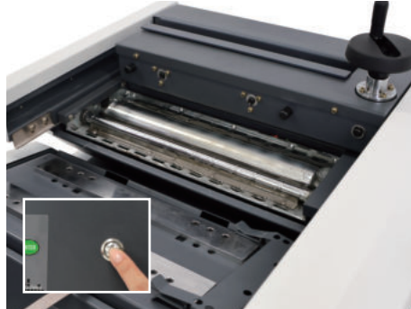
② 예열이 완료되면 알림음이 울립니다. START 버튼을 누르면 원고대가 뒷쪽으로 이동합니다.