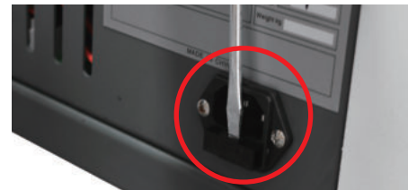
① 기기 뒷쪽 코드부분에 일자드라이버를 홈에 넣어줍니다.