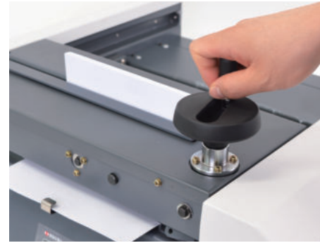
⑦ 원고고정핸들을 돌려 압착을 풀어줍니다.